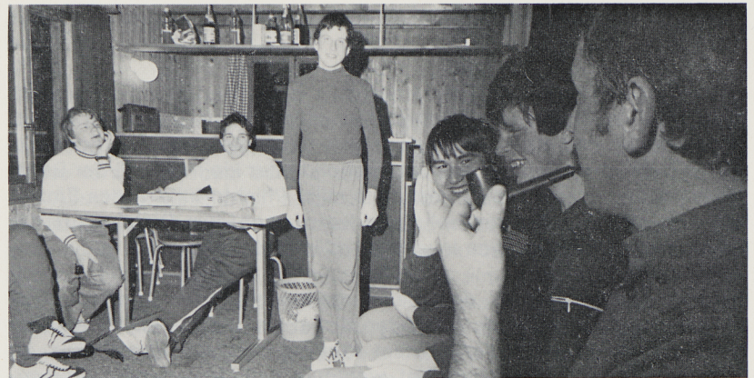
Fröhlicher Abend im Skilager