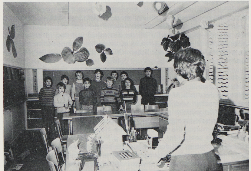
In der Mittelstufe wird viel gesungen