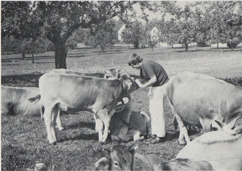
Er will Bauer werden